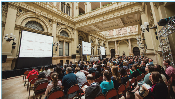
Konferencia a Corvinus Egyetem Főépületében

A konferenciához nagy számban kapcsolódtak kiegészítő tudományos rendezvények is. Így például a szűken vett