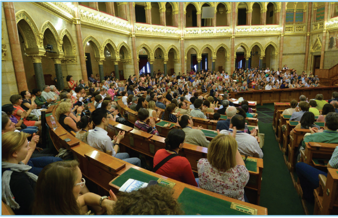
Záró szekció a Parlament Felsőházi termében

rendszere. A benyújtott előadások között legkedveltebb témának (több mint száz előadás-tervezettel) a „család és háztartás”, a „termékenység” és a „nemzetközi migráció” számított. A benyújtott tervezetek arról tanúskodnak, hogy 2014-ben felkapott témává váltak az Európát egyre jobban érintő nemzetközi vándorlási folyamatok, de hangsúlyt kaptak a kelet-közép-európai átmenet demográfiai sajátosságai, valamint az a kihívás is, melyet az öregedés jelent mind több ország számára.