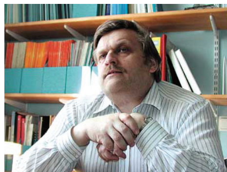
Kalev Katus

(Tallinn, 1955. október 29. – Helsinki, 2008. június 11.)